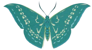
カギバアオシャク