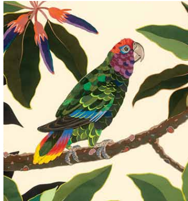
アマゾンボウシインコとオヒルギ