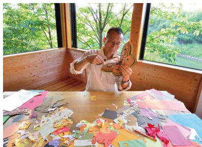
今森光彦 プロフィール

その美しさと繊細さ、優しさと力強さを増した作品群からは、自然と親しむことの根源的な喜びや安らぎを感じていただけます。