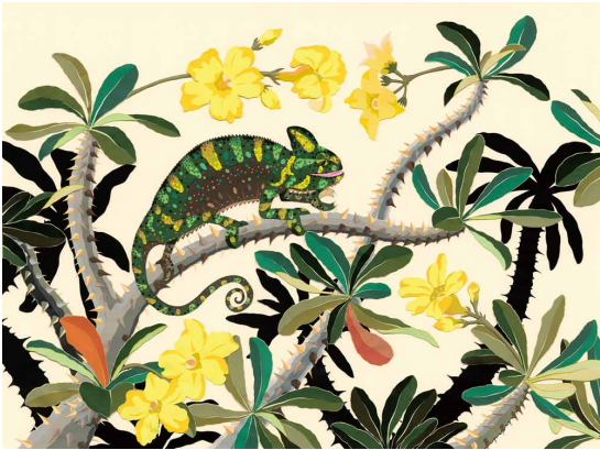
パンサーカメレオンとパキポディウム