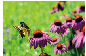
上：雑木林の中で一息。 下：キアゲハは、花が大好きだ。