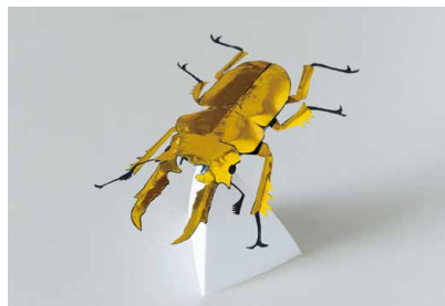
オウゴンオニクワガタ