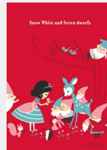
Snow White and Seven Dwarfs