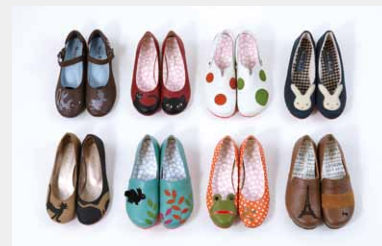
マドラスとコラボレーションしたシューズ