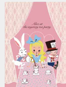
Alice in Wonderland