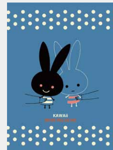
Mon Peluche (2011)