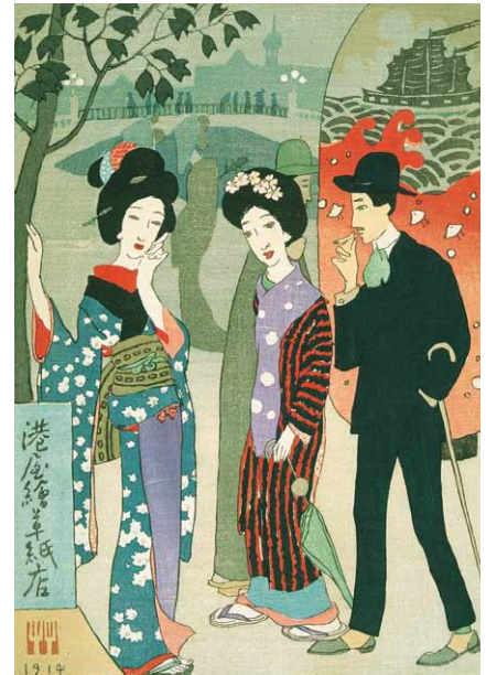
港屋絵草紙店 大正3年