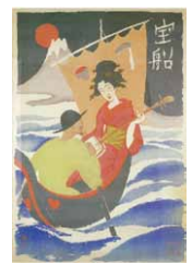
宝船 (柳屋版) 大正9年