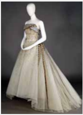
ピエール・バルマン イヴニング・ドレス 「ジャンボールのタバ」 1961年 神戸ファッション美術館蔵