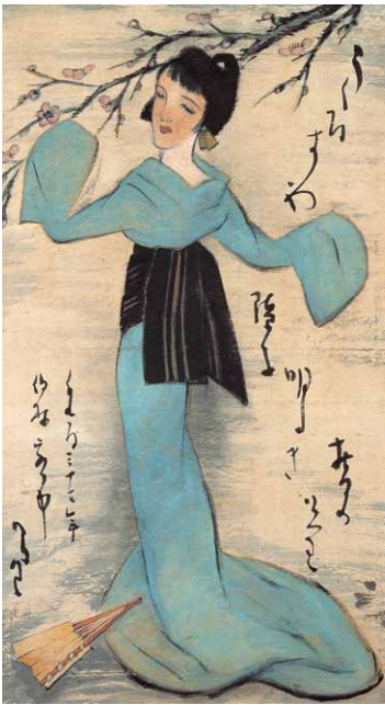
うぐいすや (留米客中) 昭和7~8年