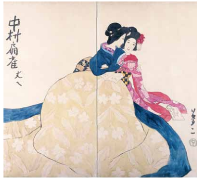
こたつ (中村扇雀文へ)