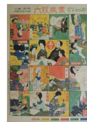
『新少女』新年号付録 家族双六