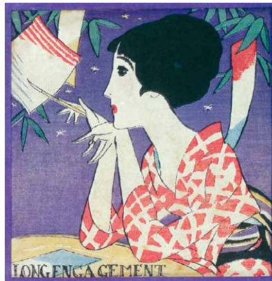
セタ 婦人グラフ (大正15年7月号表紙)