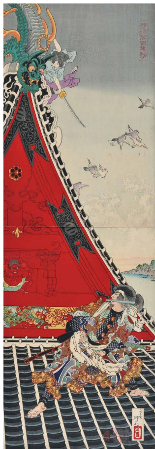
2 <芳流閣両雄動> 明治18年(1885)頃