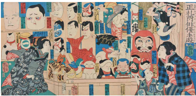
4 <正札附俳優手遊> 文久元年(1861)