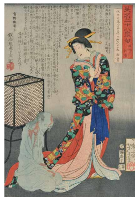
5 <英名二十八衆句 姉妃の於百> 慶応2年(1866)