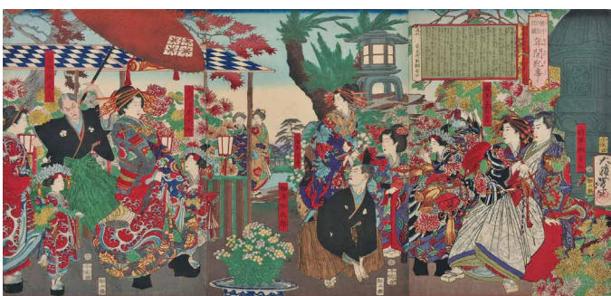
7 <徳川治蹟年間紀事 五代常憲院殿綱吉公> 明治8年(1875)頃