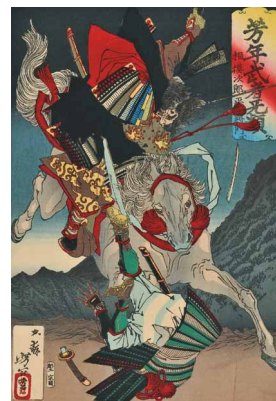
6 <芳年武者死類 相模次郎平将門> 明治16年(1883)頃