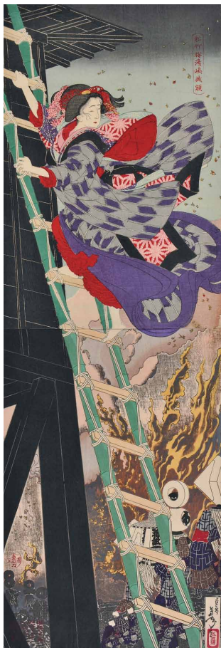
1 <松竹梅湯嶋掛額> 明治18年(1885)