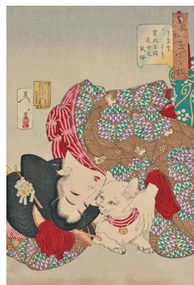
8 <風俗三十二相うるささう 寛政年間 処女之風俗> 明治21年(1888)