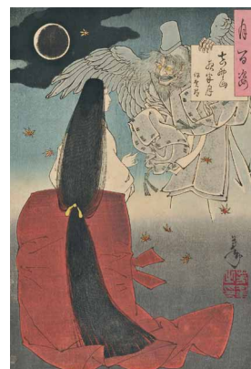
9 <月百姿吉野山夜半月伊賀局> 明治19年(1886)