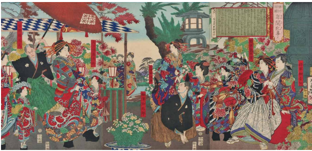
《徳川治績年間紀事 五代常憲院殿綱吉公》明治8年（1875）頃