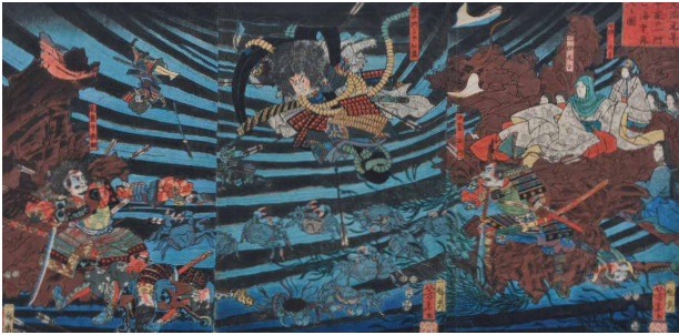
《文治元年平家の一門亡海中落る図》嘉永6年（1853）