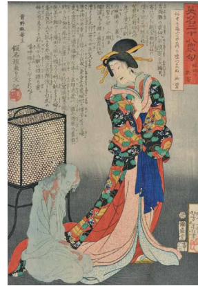
《英名二十八衆句 姫妃の於百》慶応2年（1866）