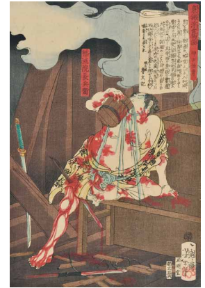
《東錦浮世稿談 輔院院長兵衛》慶応3年（1867）