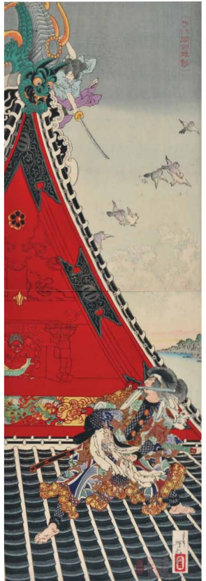
《芳流閣両雄動》明治18年（1885）頃