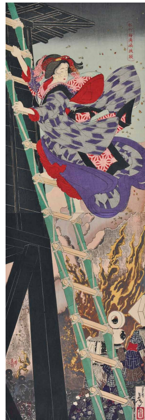
《松竹梅湯嶋掛額》明治18年（1885）